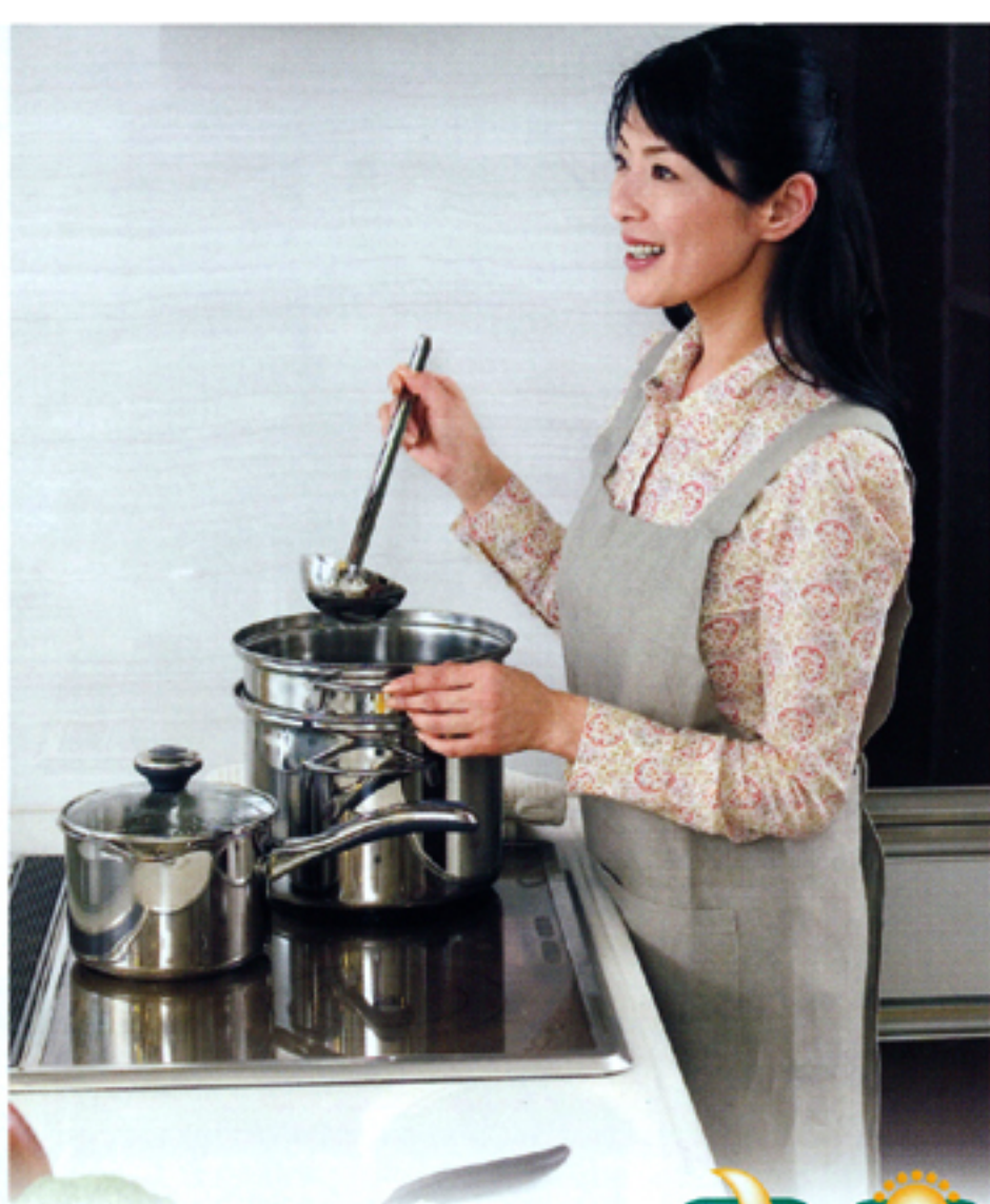
IHクッキングヒーター 昼間より安い電気 昼間より安い電気