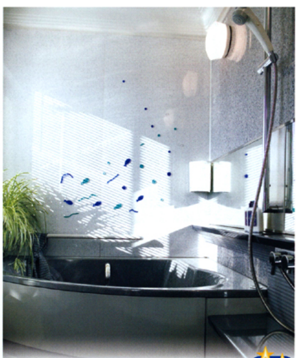
エコキュート 安い電気

安全性 炎がないので、吹きこぼれによる立ち消えや不完全燃焼などの心配もありません。